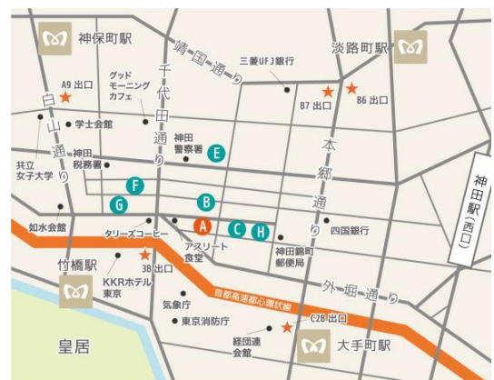
A ちよだプラットフォーム